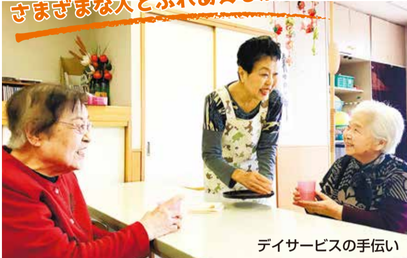
デイサービスの手伝い