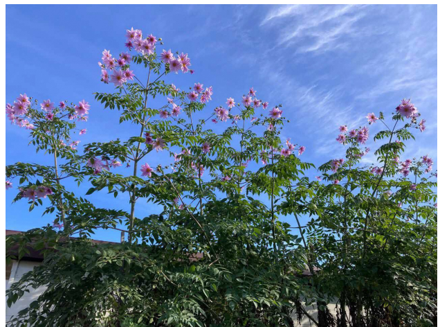
■ 子どもの遊び場に咲く丹精した皇帝ダリア