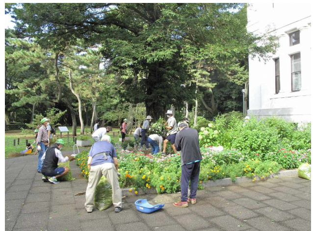
■ 大倉山記念館の前の花壇、夏の花苗の手入れの様子