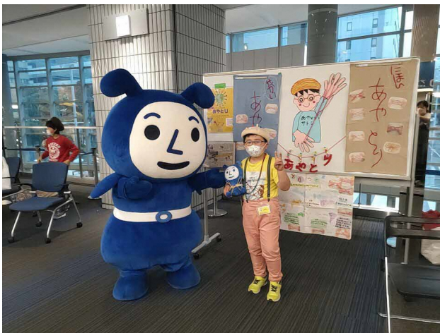
■ ヨコアリくん祭りに参加