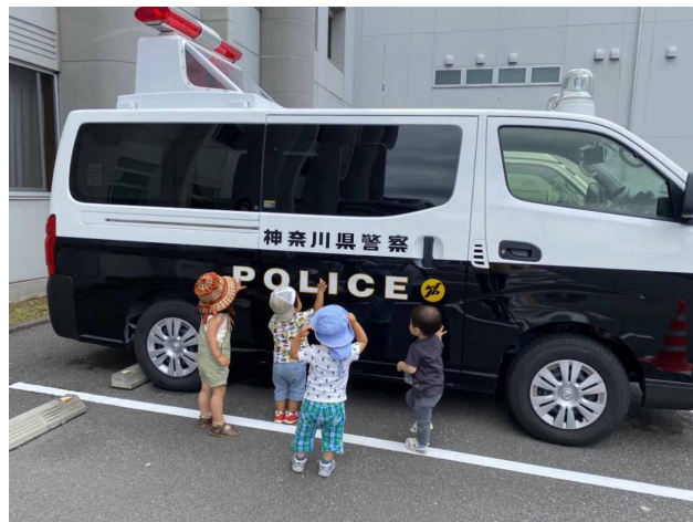
■ みんな大好き、パトカー