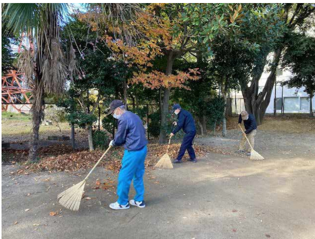
■ 子どもの遊び場での落ち葉かき