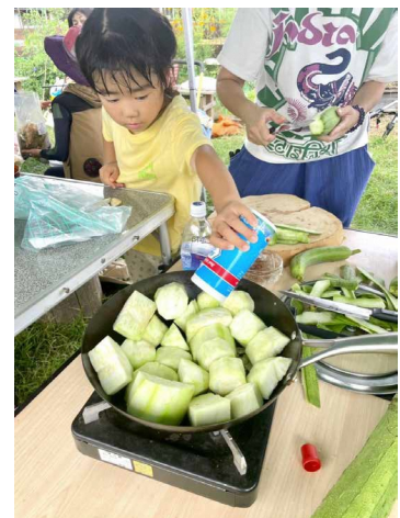
■ 採れたてヘチマでランチづくり