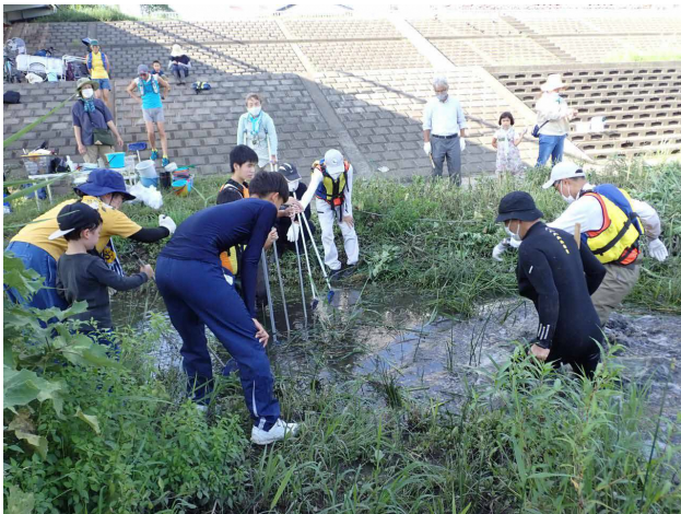
■ 鶴見川で楽しく魚とり