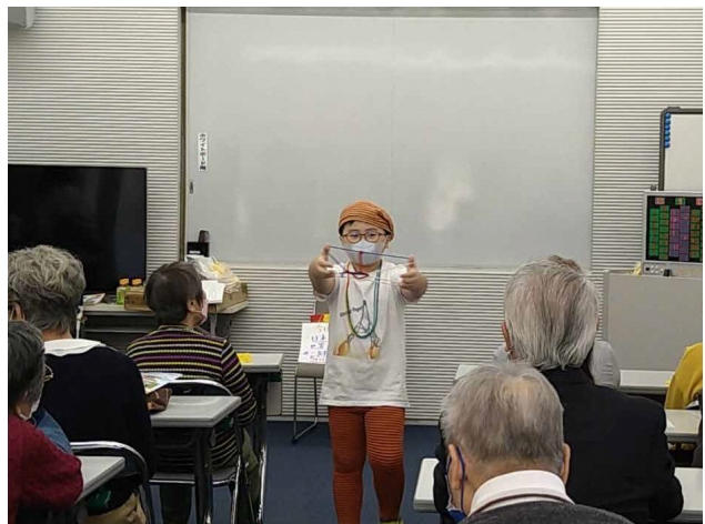
■ 地域の高齢者の方とあやとり交流