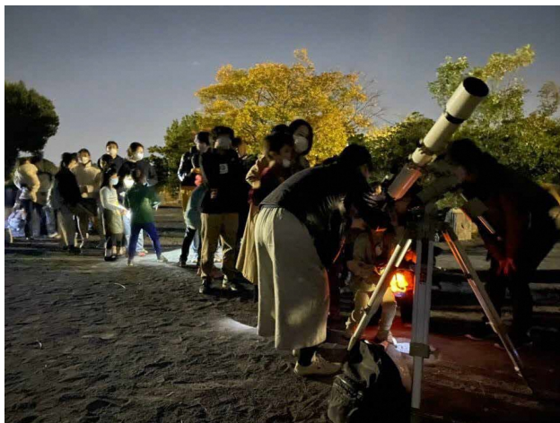
■ 太尾公園で月食の観察会