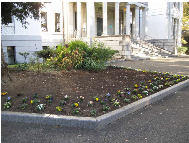
■ 大倉山記念館の前の花壇、ミックス球根と花苗を植えた直後