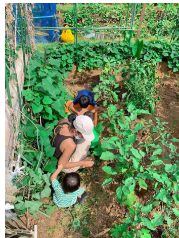
■ 野菜大きくなあれ