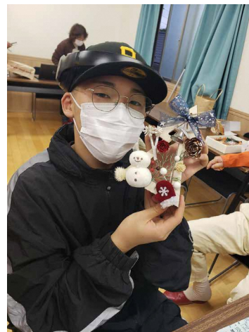
■ 高校生男子も手作りに挑戦