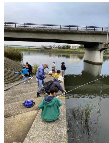
■ 鶴見川でハゼ釣り大会