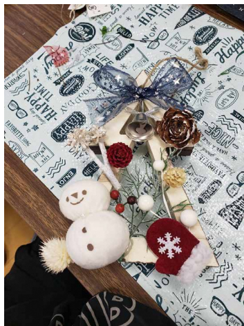
■ 多世代交流のクリスマスリース作り