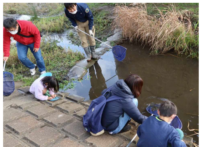
■ 足元の自然で生きものとのふれあい