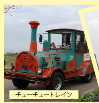
チューチュートレイン