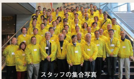
スタッフの集合写真

平成 31 年 1 月 14 日 (月)、横浜アリーナにて「成人の日を祝うつどい」が開催されました。約 37,000 人が新成人となり、午前午後の2部制で実施されました。朝8時半、市内各区より 72 名の青少年指導員が集まり、黄色いスタッフジャンパーを着用して、式典での新成人の客席誘導を行いました。緊張していたせいか午前の部では誘導に手間取りましたが、午後はスムーズに行えたように思います。