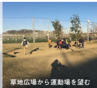
草地広場から運動場を望む