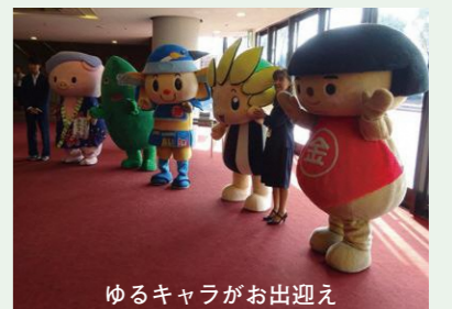
ゆるキャラがお出迎え

県央エリアのマスコットキャラクターに出迎えられ、平成 30 年 11 月 18 日 (日) 第 51 回 神奈川県青少年指導員大会が、「子どもたちの未来の応援団 ～私たち青少年指導員に求められること～」をテーマに、厚木市文化会館 大ホールにて開催されました。