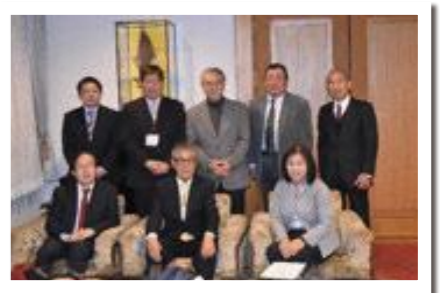
情報グループのみなさん