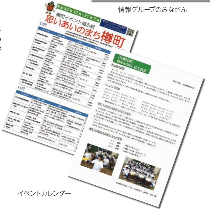
イベントカレンダー