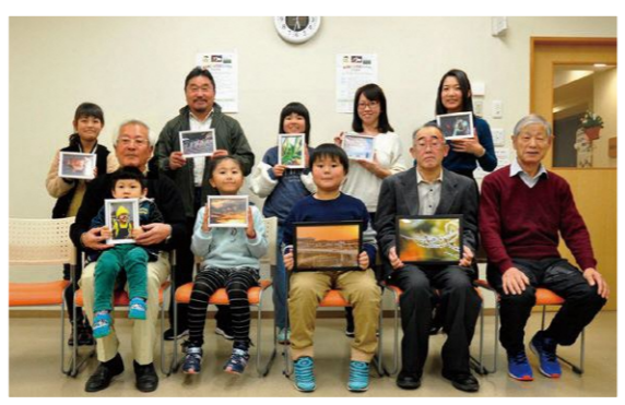
写真コンテスト入賞者のみなさん

● 「新羽中、新羽小学校での交流」をサポート 「新羽町合同敬老の集い」毎年、新羽中学校体育館で地区に住む70歳以上の方をお招きして開催されています。また、新羽小学校ではこの地区に伝わる「わら蛇づくり」が3年生の体験学習として行われています。このような取組をサポートしています。