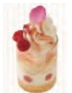
白桃&ローズのヴェリーヌ