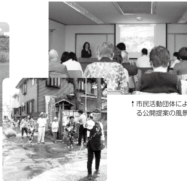
↑ 市民活動団体による公開提案の風景