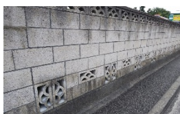
コンクリートブロック塀

(※1) ①通学路上の既存ブロック塀等の調査で、横浜市の技術職員が現地をチェックし改善の必要があると判断されたもの。 ②市職員や市が委託した専門家が現地を確認し、改善の必要があると判断されたもの。