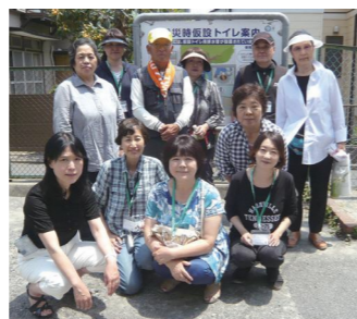
仮設トイレの設置を終えて

私たち新吉田あすなろ地区は、連合町内会との連携を深めるため地域のいろいろなイベントに参加しています。「地域防災拠点訓練」では衛生部として下水道直結式仮設トイレの設置訓練を地域の方と共に行い、「納涼福祉夏祭り」では小学生を対象に禁煙クイズ、「ふれあい運動会」では救護班として怪我の手当てを行いました。毎月「いきいき保健サロン」、年1回「健康測定会」、年1回「ウォーキング」も主催いたしました。これからも皆さんの笑顔を励みに頑張ります。