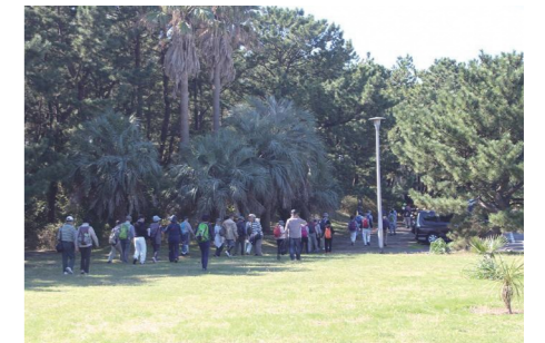
ウォーキング(平塚)