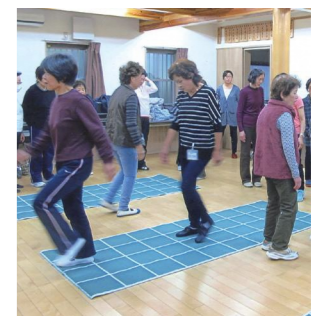
マットのます目を覚えた通りに…スクエアステップ！

参加者の和気あいあいとした楽しい雰囲気の中、心と身体の健康バランスが何より大切なのだと思います。