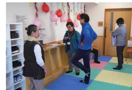
その調子、その調子♪

11月25日(日)今年で4回目を迎えた「につばらっぱフェスティバル」。私たち推進員主催の健康測定会も、楽しく賑やかに行うことが出来ました。測定のチェック項目は、血圧、体組成、足指力、座位ステッピング、立ち上がりテスト、開眼片足立ちで、リピーターの参加者はもちろん、老若男女、特に今年は子どもの参加も多く、当日は78名の参加がありました。せわしなく日々の生活を過ごしていますが、改めて測定の機会があることは、自分自身の体を見つめ直す、よいきっかけになると思いました。