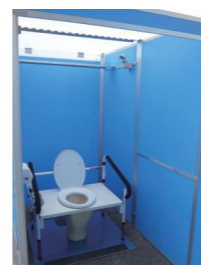
下水道直結式仮設トイレ