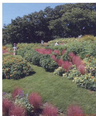
これからますます赤く色づくコキア

四季の森では、赤と白の彼岸花を見ながら226段の階段を登り里山ガーデンへ。里山では色とりどりのコスモスが咲き、チョコレート色の匂いするものも。色づき始めたコキア等秋の花を見つつ、皆でおしゃべりしながらお弁当を食べ、楽しい一日を過ごしました。