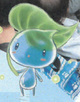
菊名ウォータープラザまつり キャラクター「みず」