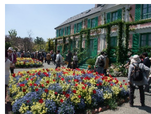
国際園芸博覧会イメージ

国際的な園芸・造園の振興や花と緑のあふれる暮らし、地域・経済の創造や社会的な課題解決への貢献を目的に開催される博覧会です。横浜市が目指しているのは国が開催主体となる博覧会で、国内では、1990年に大阪で開催された「国際花と緑の博覧会（花の万博）」があります。