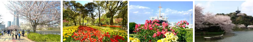
日本の春を象徴する「サクラ」横浜を代表する公園では、春にはの名所がたくさんあります チューリップがたくさん咲きます バラは横浜市の「市花」です 三溪園は敷地面積18万㎡の広大な日本庭園です

1950年以降、都市化が徐々に拡大し、樹林地や農地は減少しましたが、横浜市は、1973年に「緑の環境をつくり育てる条例」を制定し、全国に先駆けた取組により、市民の協力を得ながら、緑の保全や公園の整備を進めてきました。また、市内には我が国の代表的な日本庭園である三溪園もあります。2017年春には、日本国内の各都市で毎年開催されている「全国都市緑化フェア」を横浜市内で開催し、多くの来場者で賑わい、高い評価を受けています。