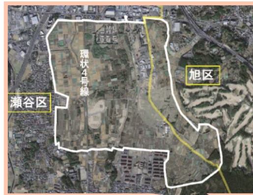
航空写真 （旧上瀬谷通信施設：約242ha）