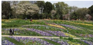
全国都市緑化よこはまフェアの様子