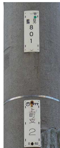
東京電力も使用しているN T T 柱