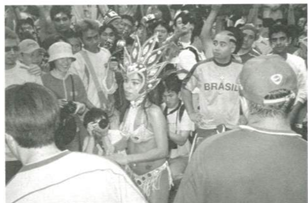
ブラジルのサンバ姿は、どこでも大人気!!