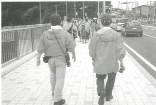
2人1組で見回ります。