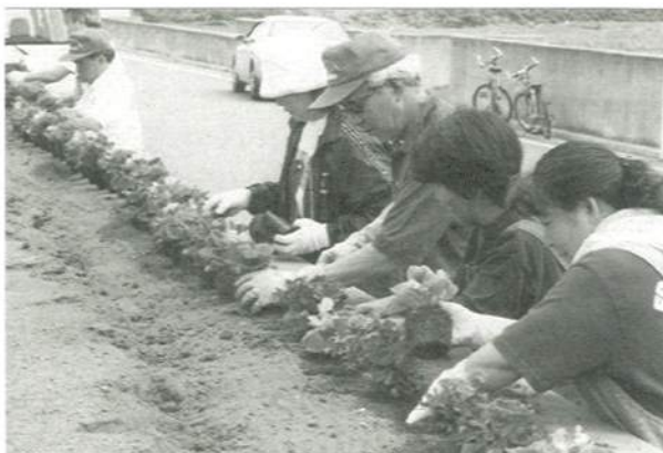
汗だくになりながら、植えました。