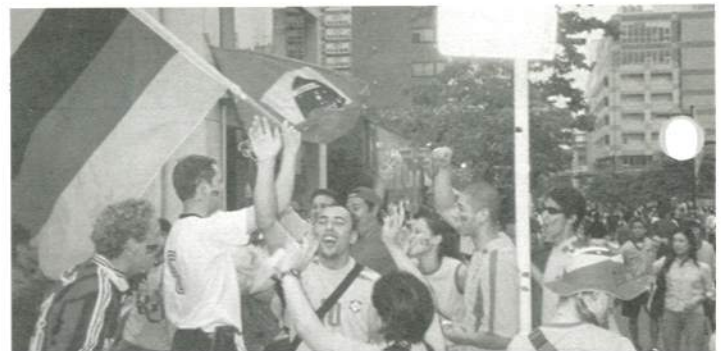
両チームのサポーター同士の交流も笑顔で。

日は、スポーツ観戦と言えばプロ野球というお茶の間でも、久々に家族全員が膝を揃えてファミリー応援団を結成し熱い団欒が繰り広げられたことと思います。街角でも、中継を見ることができるといえる店や横浜文化体育館などのイベント会場には多くの人が応援に集まり、ブルーのシャツを着たサポーターたちは、「ニッポン」と叫びながら、驚喜し走り回り、見知らぬ人同士で抱合い、ハイタッチをし、一人よりも大勢の他者と共感し合うことに喜びを見だしていました。このところ元気のなかった市民がイキイキとした表情を取り戻すことのできた瞬間でもあったように思います。