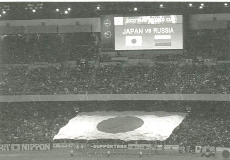
日本対ロシア 大きな日の丸が印象的