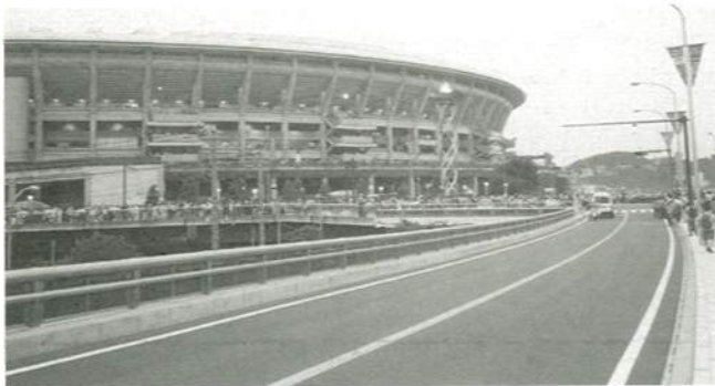
横浜国際総合競技場