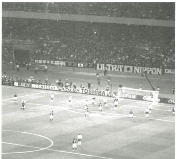
稲本選手のシュート!! (遠いですが..)