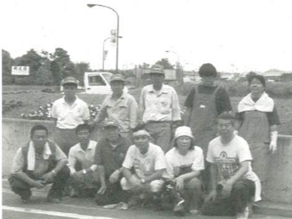
おつかれ様でした。