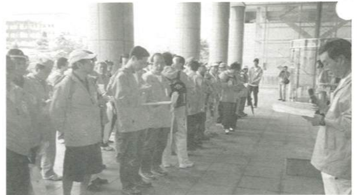
なにごともおきませんように....