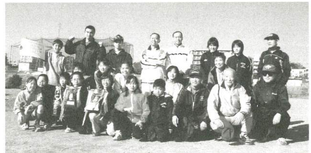
笑顔でハイチーズ。

私事ではありますが、港北駅伝大会には、一番の思い出があります。それは、第1回の大会より陸協の方々と体指の皆さんと一緒に立ち上げに参加させて頂きました。特に第1回目の大会では、役員とし又選手として参加しまして優勝することが出来ました。それから19年もたちまして今年より陸協の方と体指で実行委員会とし運営する事になりました。初めて進行役をやる事になり大変勉強になりました。第19回大会の反省会の席で陸協の方々又体指より多くの反省点が出されました。第20回大会に向けて大会役員一同、力を合わせて、節目の大会にすべく頑張りたいと思います。今後共関係する皆様方の力強い協力をお願いいたします。感想とさせていただきます。