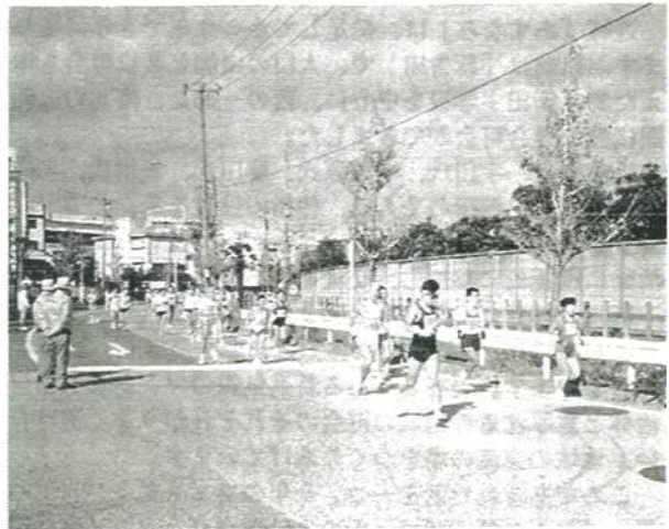
▲横浜マラソン(16km関門にて)