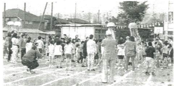
▲あすなろ地区 ふれあいフェスティバル