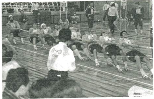
▲10月25日の本大会で奮戦する「だいあん」チーム

本大会では、善戦虚しく0勝4敗と残念な結果に終わり、大会を通して綱引きに関し港北区は他の区より5年以上の遅れがあると感じました。とは言え、公開競技な