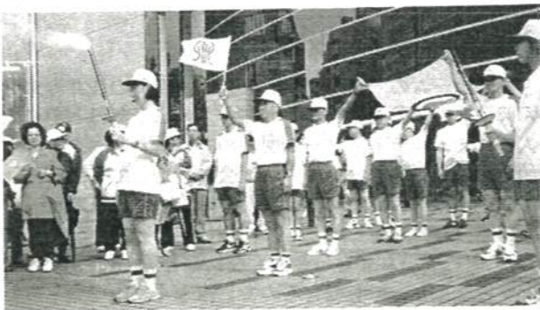
▲横浜アリーナ前でのB区間の出発式