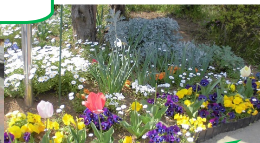
★錦が丘公園 パンジーとチューリップの花壇