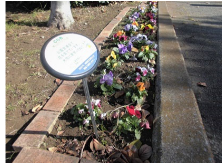
新しくできた仲手原緑道の花壇