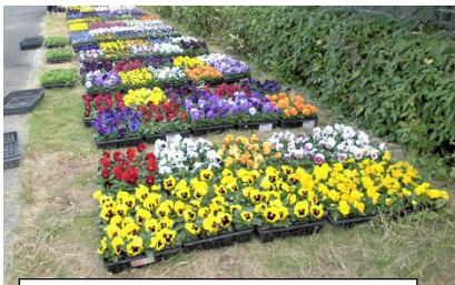
土木事務所に届いた花苗

10月または11月の指定日を選び、土木事務所に花苗を取りに来ていただきます。（昨年は2日間で46件の愛護会の方がお見えになりました）