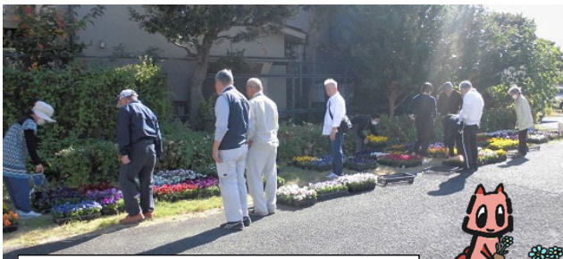
花苗を選んでいる愛護会の皆様

土木事務所からお届け日時とお届け先（公園、ご自宅、町内会館等）の確認のご連絡をします。（昨年は6日間で41件の愛護会に花苗をお届けしました）