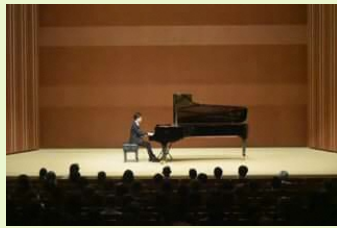
区民文化センター主催公演