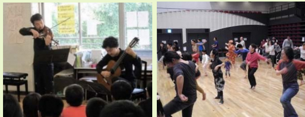
小学校向けアウトリーチ

例：学校・高齢者施設・障害者施設・病院等へのアウトリーチ、芸術文化教育プログラム、ワンコインコンサート、各種ワークショップ、市民参加型の演劇やミュージカル など