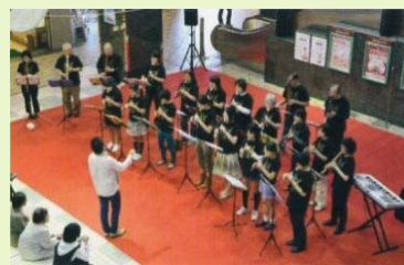
商店街でのコンサート

例：自治会や商店街と連携したまちなかプログラム、港北区内文化施設まち歩きツアー など