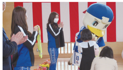
日吉台小学校の新1年生へランドセルカバーを贈呈！