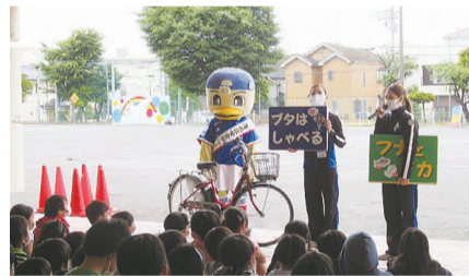
マリノスケヤトリコロールマーメイドと一緒に交通安全教室

港北区役所や港北警察署、港北交通安全協会と連携し、区内小学校(26校)で交通安全意識の醸成を図る取組を行っています。