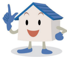
住宅・土地統計調査 イメージキャラクター ハウス君