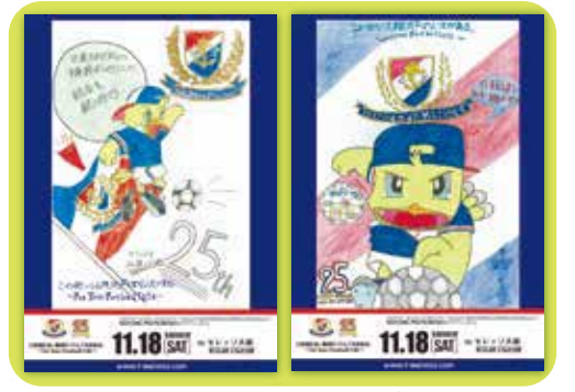
児童たちがデザインしたポスター