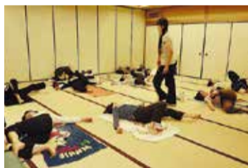
ストレッチの様子