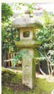
隠れキリシタンの石灯籠

金蔵寺は平安時代の貞観年中(859年～877年)に創建され、中国の神様で長寿を授けるといわれている寿老神が祭られています。本尊を