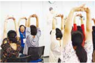
ウエルネスセンターでの教室の様子

●問合せ バイオコミュニケーションズ株式会社 ☎ 470-8001 📠 470-8200