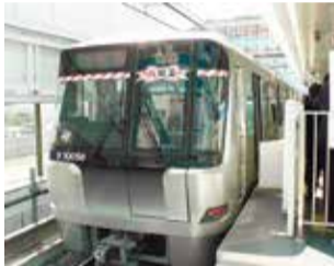
開業当時のグリーンライン

市営地下鉄グリーンラインは30年3月に開業10周年を迎えます。採用された写真はグリーンライン各駅に展示し、優秀賞10作品には記念乗車券を、佳作20作品には「はまりんグッズ」を進呈します。