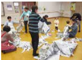
新聞紙遊びの様子

①ミニおはなし会:12月28日(木)、②新聞紙遊び:30年1月8日(月・祝)、①②10時~13時、未就学児と保護者、当日直接ケアプラザへ