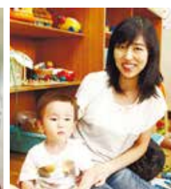
遊びに来ていた親子

会場に来て、母子共にたくさんの友達ができました。遊ぶおもちゃがステップアップしていくことで、子どもの成長を実感できます。支援者さんには、上の子の相談など、何でもお話できて、とても助けてもらっています。