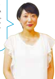
会場に来ていた妊婦さん