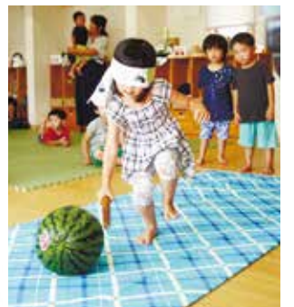
イベント(たんぼぼ保育園)の様子