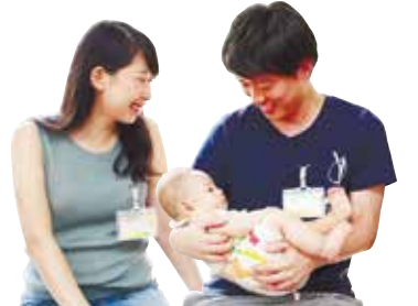
本物の赤ちゃんを抱っこする参加者

本物の赤ちゃんを抱っこするなど、貴重な経験をすることができました。子育てに関するお話を講師の方から伺うことで、出産後の生活をより具体的にイメージでき、疑問点の解消につながりました。