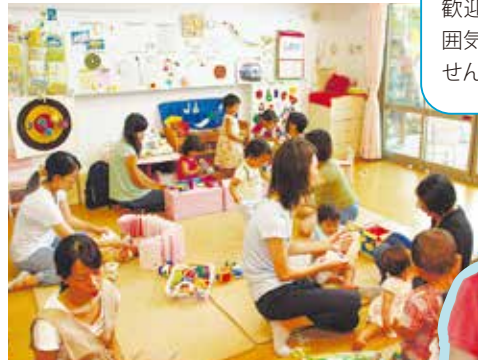
カンガルーハウス(港北保育園)

室内で天候を気にせず遊べるカンガルーハウスには、絵本やおもちゃがたくさんあります。妊婦さんの園見学なども歓迎します。温かく楽しい雰囲気の中で親子一緒に遊びませんか。