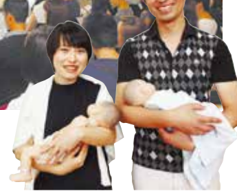
両親教室(どろっぷ)の参加者