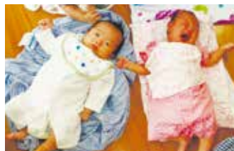
会場に来ていた赤ちゃん