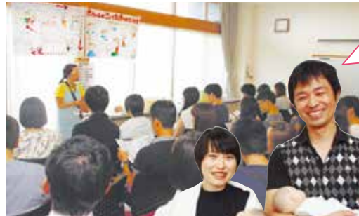
両親教室(どろっぷ)の様子