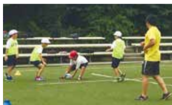
タッチラグビーでのGPSデータ取得の様子

ドローンやGPS受信機を活用したスポーツデータ収集の体験など、慶應義塾大学の教員と蹴球部から最先端のスポーツデータサイエンスについて学べる教室です。ラグビーの名門である慶應義塾大学蹴球部の試合観戦もあります。