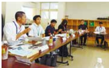
学校運営協議会の様子

区では、高田中学校ブロック(高田中学校、高田・高田東小学校)が併設型の指定を受けました。新しい学校を支えるため3校合同の「学校運営協議会」を設置し、地域と一体となり子どもを育てる体制を構築していきます。