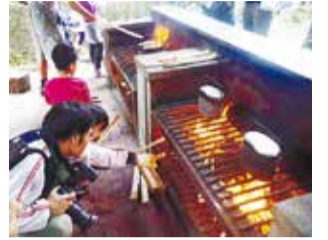
飯ごう炊飯の様子

石窯ピザ150円、手作り菓子120円、クラフト120円、手焼きせんべい120円、焼き鳥120円、ネイチャーゲーム120円、乗馬体験300円などもあります。(三ツ沢公園青少年野外活動センター)