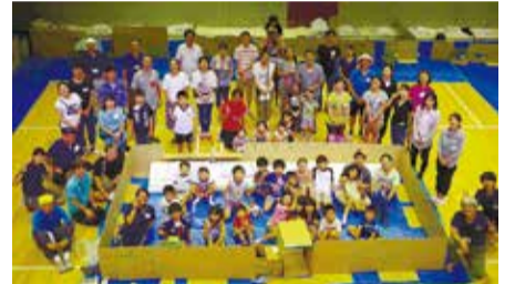
ホールでの宿泊体験

●申込 ホームページか往復はがき(8月21日消印有効)参加者全員の [必要事項] を記入