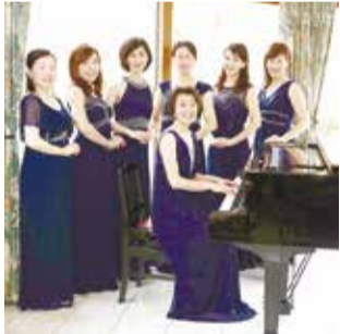
フルールの皆さん

ボーカルアンサンブル「フルール」の演奏会。9月3日(日)13時30分~14時30分、当日直接ケアプラへ