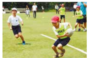
空からドローンで撮影中

その一環として、日吉台小学校5年生を対象にドローンやGPS受信機、カメラなどを使ってデータを収集・分析し、活用するための授業を行いました。子どもたちは、プレー中に真剣な表情や笑顔を見せ、