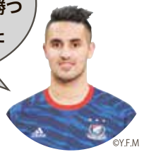
ウーゴ・ヴィエイラ選手