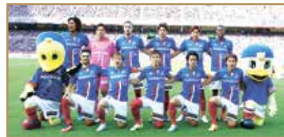
川崎フロンターレ戦での選手たち

この日に合わせて、特別デザインのユニフォームを、区内の商店街の店舗や郵便局、区役所でも着用し、みんなで一緒になって盛り上げました。