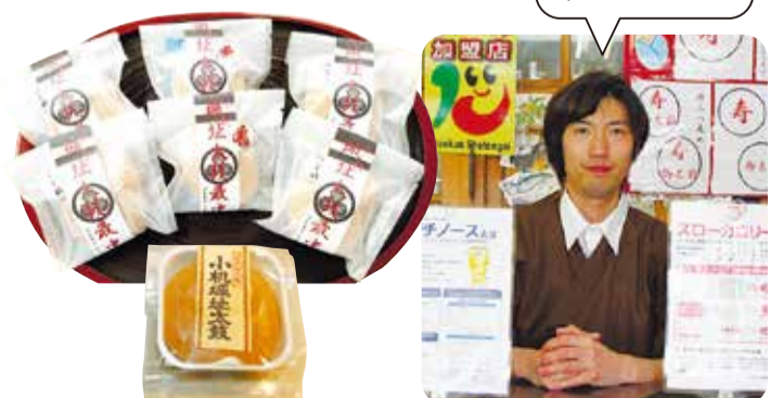
小机にちなんだ銘菓