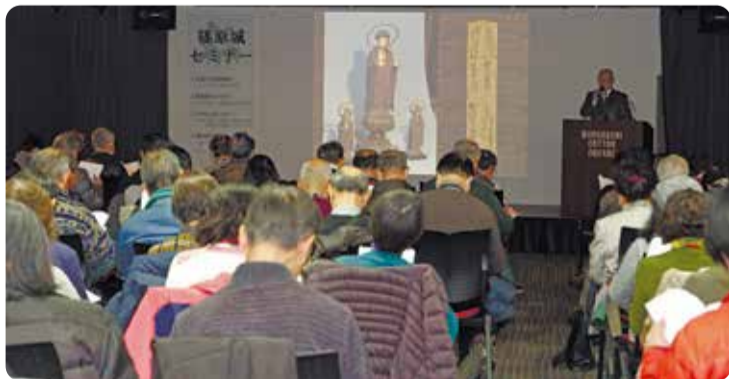
篠原城関連セミナー（3月）の様子