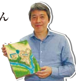
二宮さん※写真のジオラマは長篠城です

A 子どものころから城や模型が好きでした。いつか城郭と地形を再現した模型が商品化されると考えていましたが、なかなか出てこないのが、経営している会社のプロジェクトとして自分で作ってしまいました。城は「土へん」に「成る」と書きますし、地形も含めて「城」なんです。