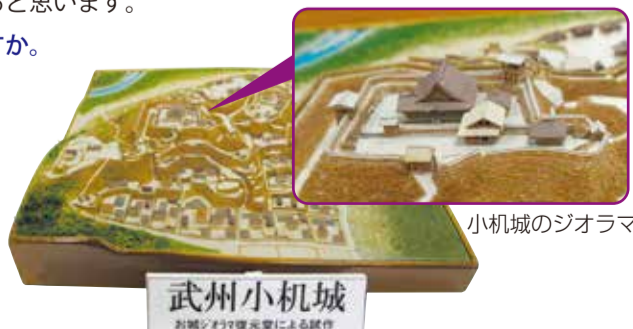
小机城のジオラマ