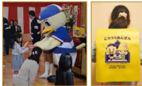
プレゼントの様子 ランドセルカバー

今年のランドセルカバーはカラーになったよ。皆さんも、交通ルールを守って、楽しい学校生活を送りましょう。