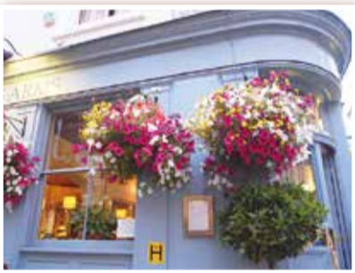
英国のハンギングバスケット

日本では、植えやすく工夫された容器も開発され、イベント会場などでは、彩りや葉の形など、植物の特徴を考えてデザインされた芸術的な作品を見ることもできます。よこはまフェアでは港の見える丘公園(中区)の展望エリアに多くのハンギングバスケットを飾ります。