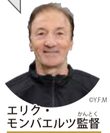
エリック・モンバエルト監督