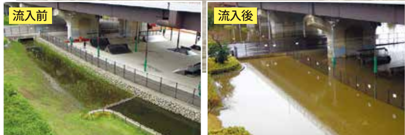
2018年3月豪雨時の鶴見川多目的遊水地の様子

鶴見川水系では、過去の水害を教訓に、鶴見川多目的遊水地の整備などの治水対策をしています。区で大きな風水害はまだ起きていませんが、近年、全国各地で局所豪雨による被害が激化しています。いつ発生するか分からない風水害から身を守るため、防災情報を収集しましょう。