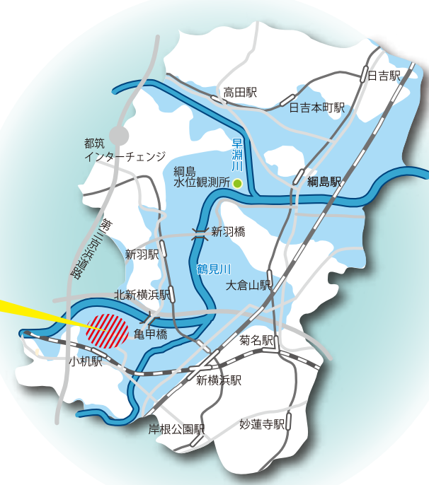
■ 浸水が想定される区域 (100年に1度の豪雨を想定)

かつて鶴見川は「暴れ川」と呼ばれ、頻りに氾濫していました。鶴見川多目的遊水地(最大390万立方メートル貯留可)をはじめとした総合治水対策により被害は減りましたが、3月の豪雨時には、遊水地に約90万立方メートルの水が流入しました。