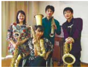
さきそーらの皆さん