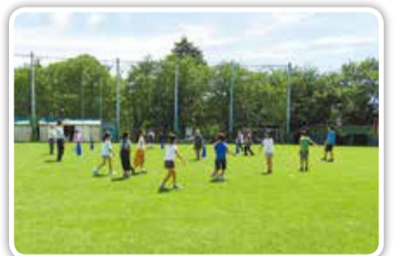
練習会の様子(高田東小学校)

高田地区では、「高田音頭」の普及を通じた地域の活性化に取り組んでいます。「高田音頭」は約40年前に、当時の高田小学校PTAにより誕生しました。