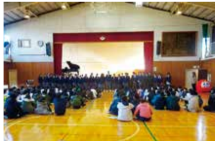
交流会の様子(生徒会歌「地球星歌」の披露)

日吉台西中学校では、入学前に中学校を知り、少しでも早く学校生活になじむことができるよう、毎年2月に下田小学校と駒林小学校の6年生を中学校に招き、授業見学や交流会を開催しています。交流会は、今年も中学生が企画し、生徒会活動や部活動の紹介をしました。