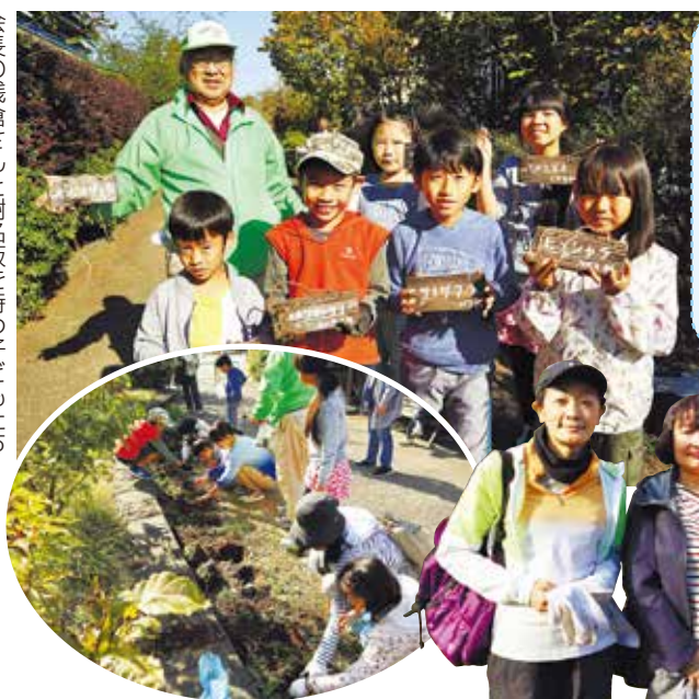
球根を植える様子

缶や瓶、吸い殻などのポイ捨てや、夏は雑草、秋は枯れ葉で通年清掃が必要です。きれいな緑道を保つため、ポイ捨てがなくなればいいと思います。