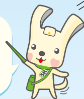
スリム「ヨコハマ3R夢!」マスコット イーオ