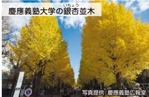
慶應義塾大学の銀杏並木

東急線日吉駅前の正門から日吉記念館に続く坂道にある約100本の銀杏は、日吉のまちのシンボルとなっています。