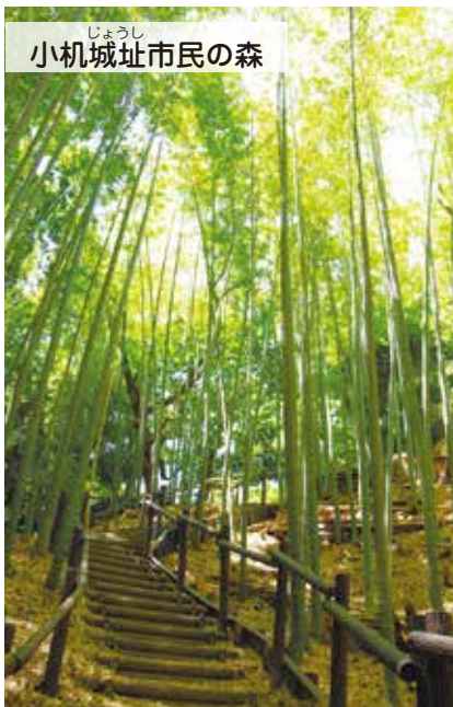
小机城址市民の森

小机城址を市民の森として整備しており、迫力満点の巨大な空堀や、土塁・本丸・二の丸などの主要な遺構が、ほぼ原形のまま残されています。