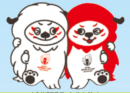
大会公式マスコット(レンジー)