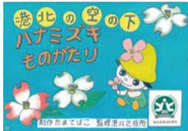
「港北の空の下 ハナミズキものがたり」

区制80周年記念事業として制作しました。日米友好の花「ハナミズキ」がどうして区の花になったのかわかりやすく描かれています。「たまたまばこ」の皆さんの集大成です。