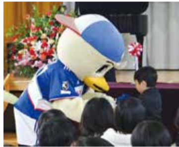
ランドセルカバー贈呈式の様子