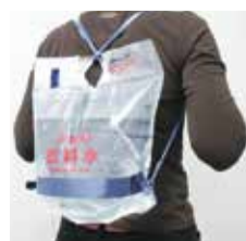
リュック型の給水袋

災害時給水所などで水をもらうときに備えて、水を入れる容器と運ぶための手段も準備しておきましょう。水は重いので、自分の体力や自宅までの道(階段の有無など)に合わせ、準備しましょう。