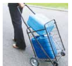
水を運ぶためのカート