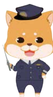
港北警察署キャラクター「ぼのちゃん」

そのほか、 ガス・水道・電気等の点検業者を装った強盗事件 が区内で発生しています。十分ご注意ください。