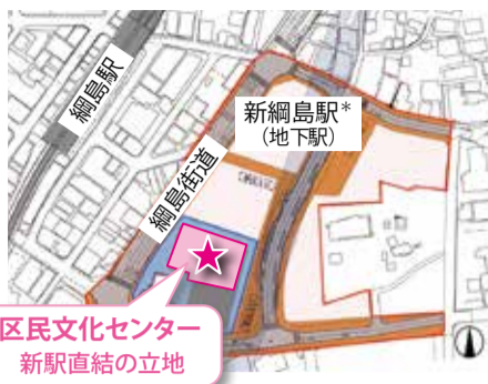
区民文化センター 新駅直結の立地

2020年11月に再開発ビルの工事が着工されました。今後、区民文化センターの愛称を決める等、2023年度下期の開館を目指し、整備を進めていきます。