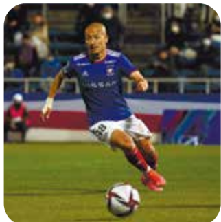
横浜F・マリノス 前田大然選手 (38番FW)