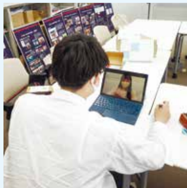
動画制作もオンラインで

KEIO 2020 projectは、事前キャンプが行われるにあたり、「英国選手団を一番に支えるチームでありたい」という強い想いを胸に、英国選手を応援する動画を制作しました。撮影には地域の皆さんにも参加していただき、苦境の中でも前を向いて進み続ける選手への応援メッセージを集めました。