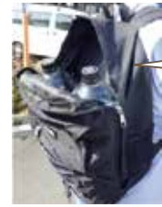
ペットボトルとリュックサック

災害時給水所には水を入れる容器の準備はありません。飲料水の備蓄と併せて、容器と運ぶための手段も準備しておきましょう。水は重いので、自分の体力や自宅までの道(階段の有無等)に合わせたものを準備してください。