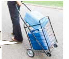
ポリタンクと運搬用のカート