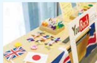
装飾した協生館内の様子(慶應義塾大学 広報室提供)