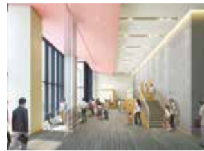
ホワイエ(イメージ)

区民の皆様の多様な文化が集い、触れ合い、港北区をさらに心豊かな文化のまちにしていく拠点となるように、「ハートでつながるわたしたちのまち」という基本理念の下、区民文化センターの「愛称」を募集します。