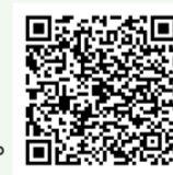
自宅視聴の申込はこちら