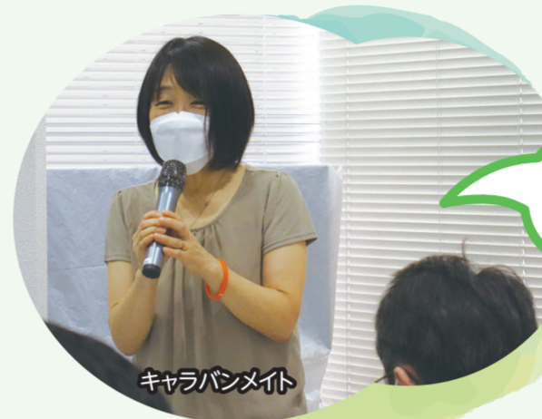
キャラバンメイト

認知症サポーターは、「認知症サポーター養成講座」で認知症について学び、地域や職場で認知症の人や家族を温かく見守る応援者です。「認知症サポーター養成講座」は地域の人が認知症についての講座を受け、ボランティア(キャラバンメイト)として開催しています。