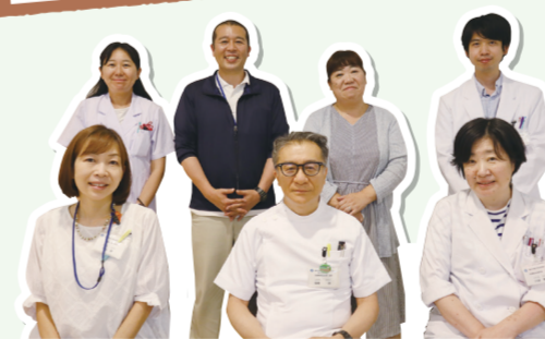
認知症初期集中支援チーム