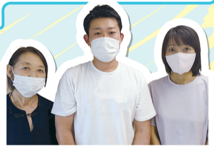
▲スタッフの皆さん