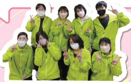
▲スタッフの皆さん

「港北小学校放課後キッズクラブ」では、子どもたちが明るく元気に、日々笑顔が絶えないような活動を心掛けています。室内ではボードゲームやあや取り、こま回し等の様々な遊びを、体育館ではドッジボール等の体を動かす遊びを取り入れています。感染症対策として、おやつは体育館で十分な距離を取って食べています。