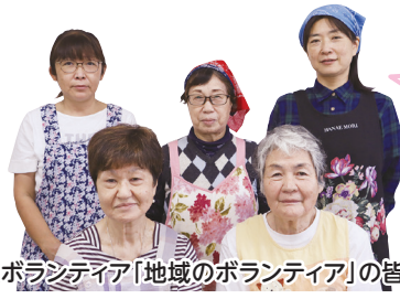
調理ボランティア「地域のボランティア」の皆さん

障害のある家族の介護で家に居ることが多いので、みんなで話ができるのが楽しいです。