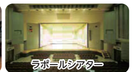
ラポールシアター

〒 222-0032 港北区 障害者スポーツ文化センター横浜ラポール ☎ 475-2001 ☎ 475-2053