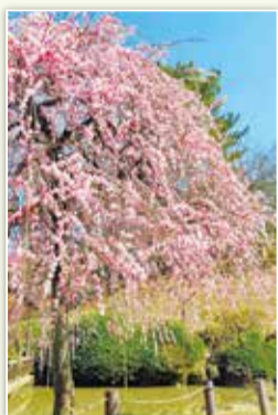
2021年最優秀賞 「春風に乗って～ココロオドル～」

2021年入賞作品展 日時 2月22日(火)～28日(月) 10時～17時(22日は13時～) 場所 大倉山記念館