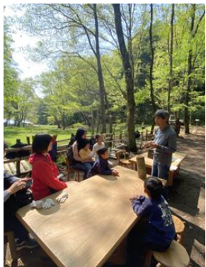
筍ってどんな風に生えるかな?