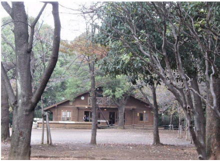
綱島公園（ログハウス）

綱島市民の森、綱島公園などを森林インストラクターと共に巡り、秋の植物にふれ合います。