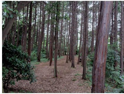
綱島市民の森檜林