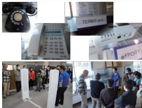
通信機器と前回の見学の様子