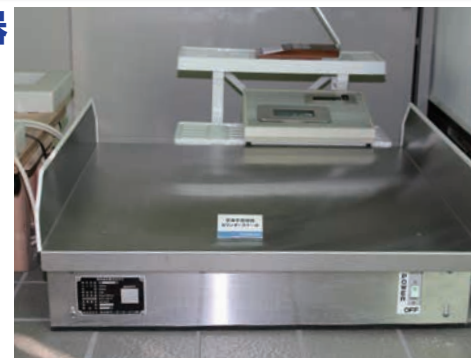
空港での荷物の台はかり