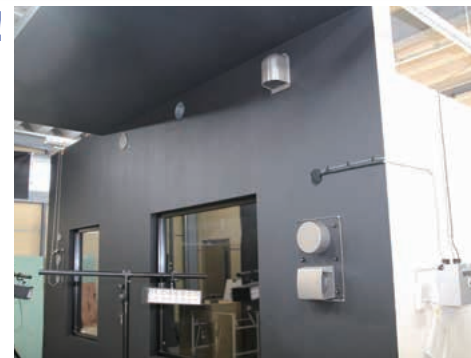
本社内にある製品実験用モデルルーム