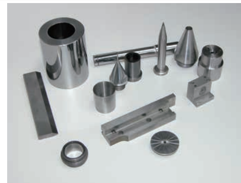
超硬合金を加工した製品