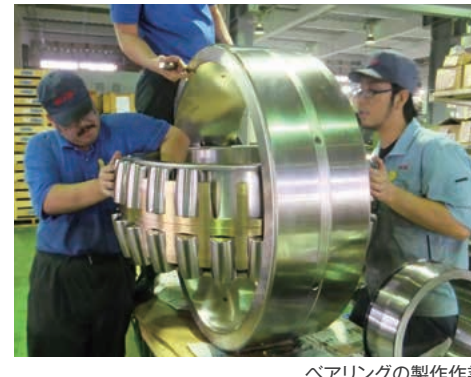
ベアリングの製作作業