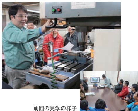
前回の見学の様子