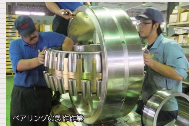
ベアリングの製作作業

自動車のエンジンや遊園地の観覧車など回転する部分に使われ、様々な機械にとってなくてはならない「ベアリング」。そのベアリングを国内で唯一、オーダーメイドで製作している日本軸受加工株式会社。コインサイズから直径125センチメートルまで様々なベアリングを製作しています。