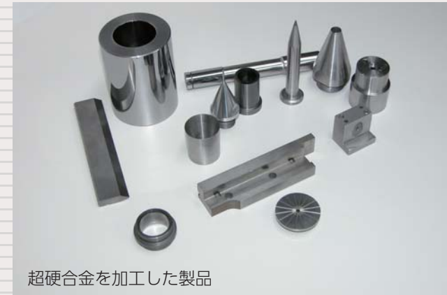
超硬合金を加工した製品

株式会社東京ダイスは、昭和23年に目黒区で創業し、平成19年に港北区に移転しました。ダイヤモンド工具でしか削ることができないとても固い素材の超硬合金の研磨加工、超微細加工を得意とし、その技術を駆使して製作される流体制御製品は自動車工場での塗装などに使われています。