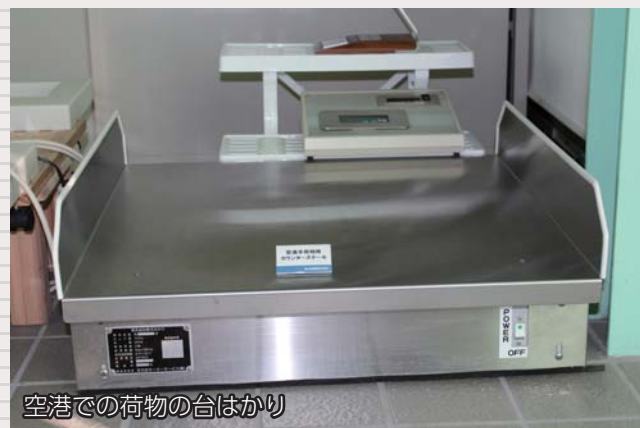
空港での荷物の台はかり

計量計測の総合メーカーとして昭和61年に創業した東洋測器株式会社。平成23年には、神奈川県より「神奈川県優良工場」の表彰を受けました。寝たまま体重が測れる体重計、リハビリの際の歩行バランスの計測器など医療現場をはじめ、空港での荷物の台はかりなど様々な場所で使われています。