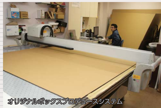
オリジナルボックスプロデュースシステム

昭和36年創業のニッパ株式会社は、主に段ボール包装の企画、デザイン、製造を手掛けています。地域貢献と働きやすい職場づくりに取り組み、平成21年には横浜市より「横浜型地域貢献企業」に認定、「よこはまグッドバランス賞表彰事業所」に認定されました。