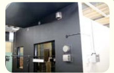
本社内にある製品実験用モデルルーム

風を司る精霊「シルフ」に由来する社名の換気口メーカー。皆さんのお部屋の換気は、給気と排気の複雑なバランスで成り立っています。実験用モデルルームでの科学的なシミュレーションを楽しんでいただけます。平成30年度の横浜知財みらい企業に認定されています。