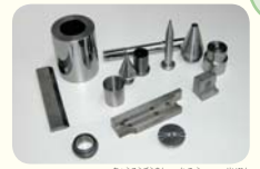
超硬合金を加工した製品

ダイヤモンド工具でしか削ることができない、とても硬い素材の超硬合金を、高い技術力によりマイクロレベルで加工します。緻密な技術で作られた製品が、スピーディで美しい自動車の塗装などを支えています。「マクロアイ・ミクロテック」をモットーに、様々なニーズに職人技で応えています。