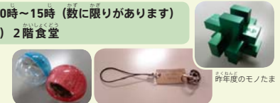
昨年度のモノたま