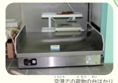
空港での荷物の台はかり

計量計測の総合メーカー。金属などに生じた、目に見えない小さな変形(ひずみ)を正確に捉え、電気信号に置き換える「ひずみゲージ」は技術の結晶。実に様々な技術や製品を楽しんでいただけます。「新しいこと、世の中にないものをつくり、それがお客様に喜ばれるのがやがいです。」