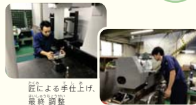
隙による手仕上げ、最終調整

自動車部品からペットボトルまで、色々なモノを寸分違わずの中に送り出す精密測定機器のメーカー。緻密なモノづくりの世界を、設計から製作まで一貫してご覧いただけます。たくさんのお客様の自動車や航空機のエンジンの「すきま」も主力商品です。目には見えない「すきま」の作り方を、ぜひ直接聞いてみてください。