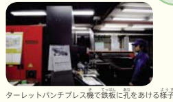
ターレットパンチプレス機で鉄板に孔をあける様子

エレベーター等の自動で動く電気機器や設備は、「制御盤」という箱でコントロールされています。そんな制御盤がどのようにつくられているのか、ぜひご覧ください。平成28年度に横浜型地域貢献企業の認定を受けました。