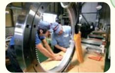
ベアリングの製作作業

自動車や観覧車など回転するものにはなくてはならないベアリングを、オーダーメイドで製作する国内唯一のメーカー。ジェット機のエンジンのベアリングは、1分間に10万回の回転にも耐えられます。人工衛星にも使われる高い技術力と果敢な挑戦で、どんなニーズにも対応していきます。